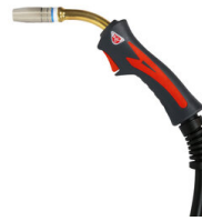
MT25 TORCIA MIG 4M 742184