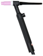
ST26V TORCIA TIG AX50 4M 742058