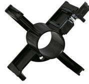
ADATTATORE BOBINA 200 MM 802486