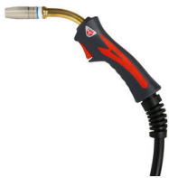
MT25 TORCIA MIG 5M 742185